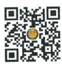
คู่มือการคัดเลือกฯ