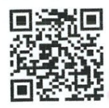
แบบฟอร์มสำหรับผู้สมัคร